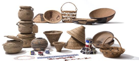
Ensemble d'objets en vannerie, 19ème-20ème siècles, auteur-e-s non documenté-e-s, Afrique australe, achat, MCAH fonds DM-échange et mission.