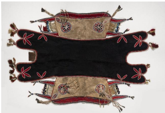
Sel aen royoon , selle à coussin Métis, 1 ère moitié du 19 ème siècle, auteur·e·s Métis non documenté·e·s, vallées des rivières Rouge et Assiniboine, Plaines du nord. Peau (de bison ou d'orignal), tissu de laine de mouton, tissu de coton imprimé, perles de verre, métal, piquants de porc-épic, tendon. Don ?, MCAH, I/D-375.