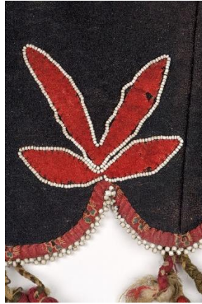
Détails, Sel aen royoon, selle à coussin Métis, 1ère moitié du 19ème siècle, auteur-e-s Métis non documenté-e-s, vallées des rivières Rouge et Assiniboine, Plaines du nord. Peau (de bison ou d'original), tissu de laine de mouton, tissu de coton imprimé, perles de verre, métal, piquants de porc-épic, tendon. Don ?, MCAH, I/D-375.