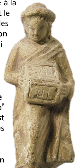
Statuette de jeune garçon.

Fruit d'une collaboration entre scientifiques de l'École suisse d'archéologie en Grèce et l'équipe du musée cantonal , l'exposition permet aussi de découvrir les moyens développés par le MCAH et les chercheurs pour initier petits et grands à cette actualité brûlante de l'archéologie.