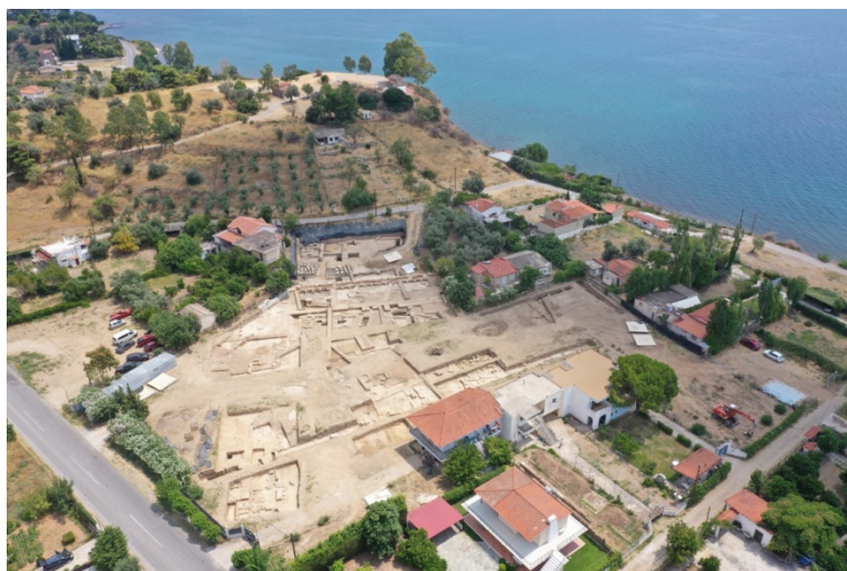
Fouilles du sanctuaire d'Artémis à Amarnthos sur l'île d'Eubée (Grèce)

https://www.dropbox.com/sh/lqvuxibofv36mms/AAA4ZbG1vE1dreHBkAykVVPea?dl=0